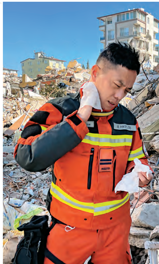
雖然已經疲憊不堪， 但休息一會，便趕快繼續搜索， 誓與時間競賽。