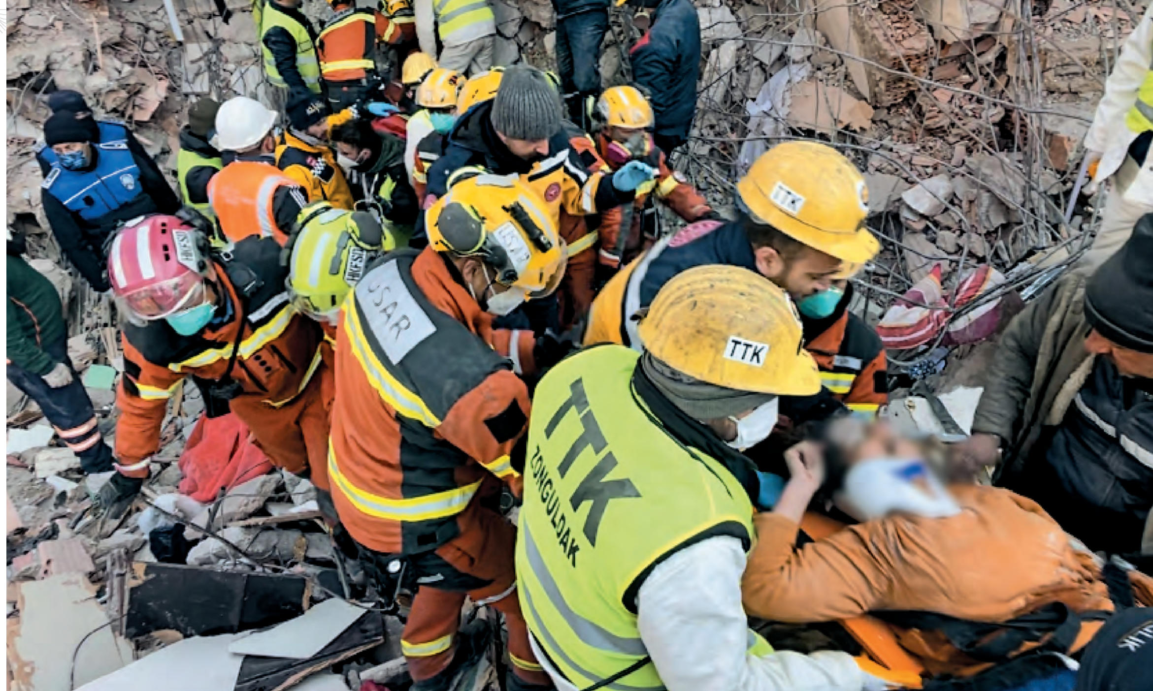
{ 特區救援隊的努力沒有白費，來到2月13日， 奇蹟再現，又一被埋於瓦礫的人重出生天。 }