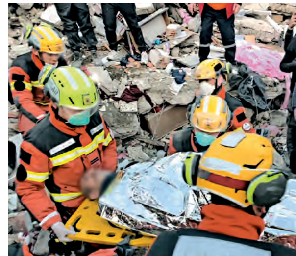
{ 特區救援隊鏗而不捨， 同日稍後，再救出兩名倖存者。 }